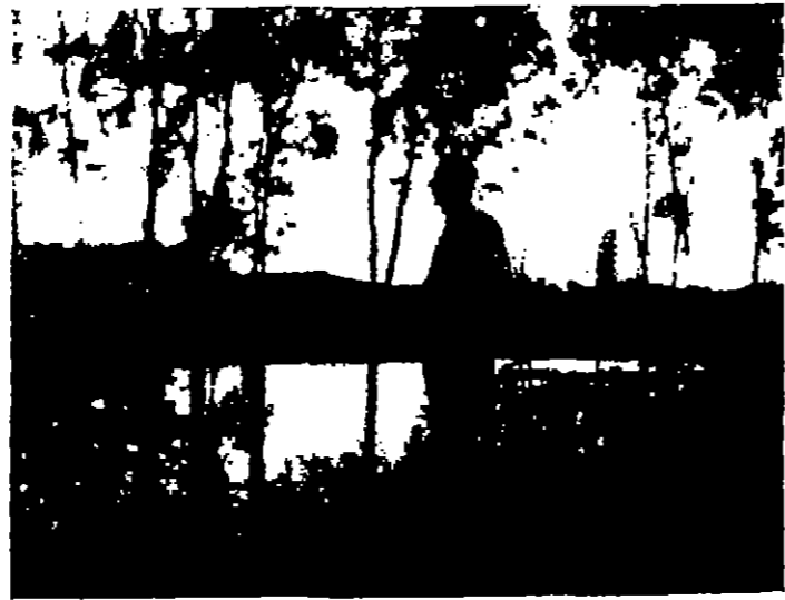
الكتب بنامل بحرة كوشونج ساعة الغروب

خلال زيارتي للصين الوطنية اتحت لي الفرصة ، لزيارة عدد من المدن الرئيسية في جزيرة « تايوان » والتجول في العاصمة « تايبيه » والمناطق المجاورة لها . وفي اليوم التالي لوصولي زرت بعد الظهر ( جبل الضباب الأخضر ) الذي يقع شرقي العاصمة ، انه ليس جبلا واحدا بل سلسلة من الجبال الشاهقة تتغطى اشجار ( البامبو ) والسرور وتتدفق منها ينابيع والشلالات وتغطي سفوحها الاعشاب الكثيفة والازهار الوردية . لقد كنت انظر عشرات الصور الملونة المرسلة واسجل انطباعاتي ، على عجل ، محاولا ( اقتنص ) هذا الجمال الطاقني الذي يصنع امتزاج اللون الأزرق في السماء الجبال الموشحة باللون قرح بالسحب الصفرة والنبضات الملونة فوق القمم كمنها تيجان من القطر المتدفق ... ولكن هيهات .. لا « الكلبيا » اسعفتني ولا الكلمات !